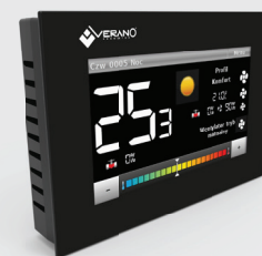
Regulator w wersji czarnej VER-24C