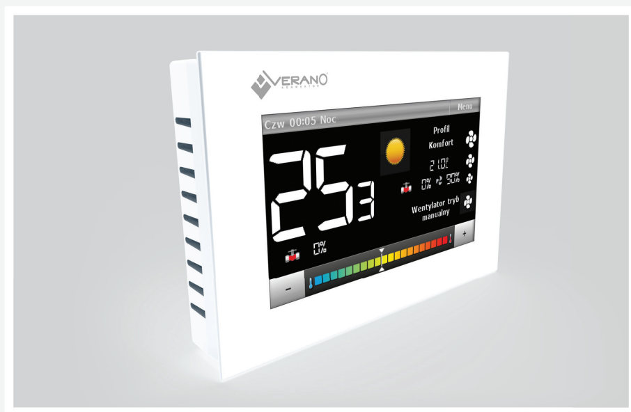
Regulator w wersji białej VER-24B